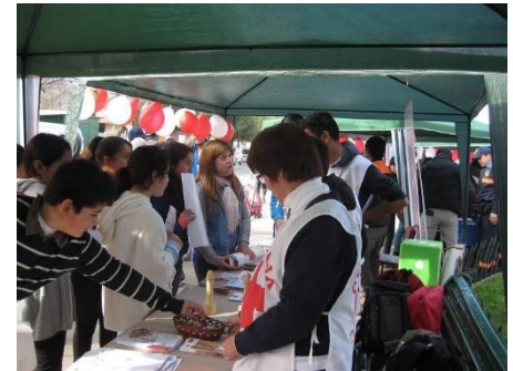
Feria Informativa de Protección Civil 2015

En este camino hacia la construcción de comunidades resilientes y seguras de forma articulada e integradora a través del empoderamiento de los diferentes actores locales, entre las instituciones públicas y privadas, y las comunidades, Cruz Roja Americana ha propuesto cuatro impulsores para el cambio de conducta comunitario: Capacidades, Actitudes y Prácticas (CAP), Organización Comunitaria, Gestión del Ambiente Físico (GAF) y Abogacía. A través de estos impulsores se desarrollan las actividades comunitarias orientadas a la resiliencia. Sin embargo, al ser un proyecto integral e integrado permite reflexionar sobre las acciones implementadas en las comunidades, así como las dinámicas institucionales al interior de las Sociedades Nacionales de la Cruz Roja, en sus diferentes niveles de gestión, y fuera de ellas con las entidades públicas, privadas y todas las partes interesadas que contribuyan a la sostenibilidad de las acciones comunitarias.