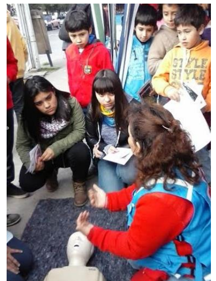
Voluntarias educando a la juventud sobre Primeros Auxilios Básicos